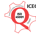
Sistema di Gestione della Salute e Sicurezza UNI EN ISO 45001:2018 CERT-022-2021HSMS-ICEC